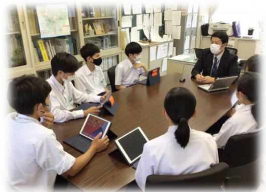
(生徒会と大塚製薬担当者の打ち合わせ)

熱中症対策・防災対策として舞鶴市内の中学校に自動販売機が設置されることとなりました。現在、生徒会本部役員会で使用についてのルール作成を行っています。(写真は打ち合わせの様子です。職員は参加していません。)詳細は準備が整い次第、追ってご連絡させていただきます。よろしくお願いいたします。